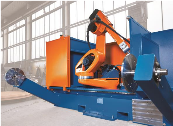
Bild 1: Das neue All-In-One-System verbindet hohe Produktivität mit optimaler Wirtschaftlichkeit.

Im Fokus stand dabei die Cloos-Prozesskompetenz beim Schweißen und Schneiden unterschiedlichster Eisen- oder Nichteisenmetalle. In Live-Demos werden die vielfältigen Prozesse zum Schweißen von unterschiedlichen Materialien in verschiedenen Stärken präsentiert. Bei Vorführungen im Handschweißbereich konnten die Fachbesucher zudem die komplette Qineo-Modellreihe an Schweißstromquellen erleben.