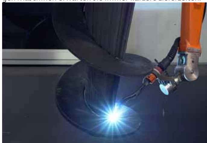
Bild 1: Der Roboter schweißt die anspruchsvollen Radialnähte der Schneckenverdichter gleichmäßig in konstant hoher Qualität.