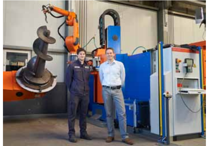
Bild 4: Durch den Zwei-Stationen-Aufbau kann die Anlage wechselseitig besetzt werden – ein enormer Zeitgewinn im Prozessablauf.

Bisher wird eine Variante der Schneckenverdichter mit der CLOOS-Roboteranlage geschweißt. Künftig sollen 70 Prozent der Schneckenverdichter über die neue Anlage laufen. Weitere Erneuerungen und Modernisierungen sind in der gesamten Fertigung geplant. „Sicherlich werden wir in Zukunft weitere Bauteile, wie Container oder Vorbauten, automatisiert schweißen,“ sagt Stolz. „Mit Innovationen und Investitionen wollen wir unseren Standort langfristig stärken.“